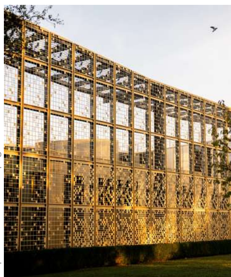
Siège social de la Maison Piper-Heidsieck

Historial franco-allemand du Hartmannswillerkopf - 68700 Wattwiller