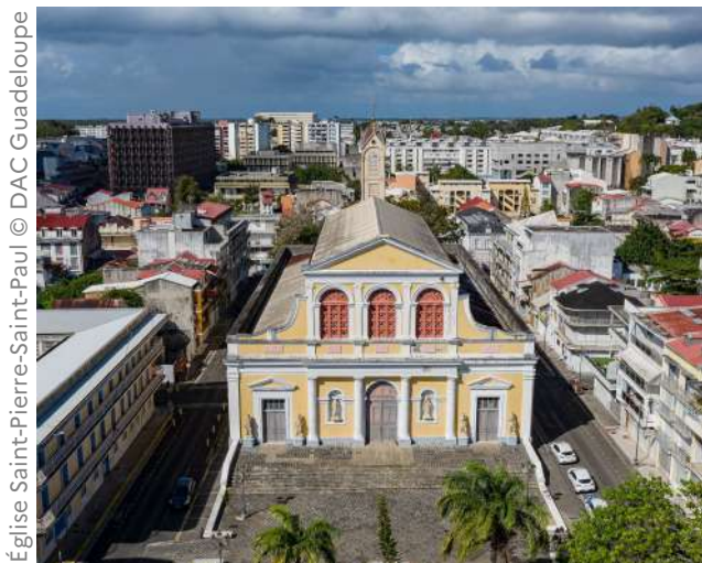
Église Saint-Pierre-Saint-Paul

Lycée Baimbridge : 97139 Boulevard des Héros, 97139 Les Abymes